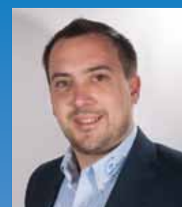
Fabian Spamer IT & Consulting