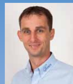
Volker Pelzer Technik